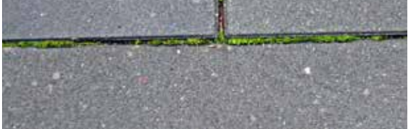
Figure: MPVA Neuwied

7 Green deposits on the screed in front of the garage