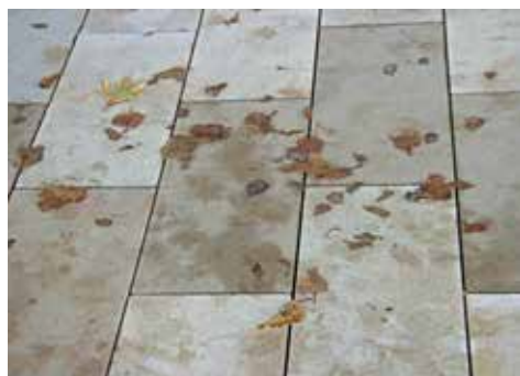
Figure: MPVA Neuwied