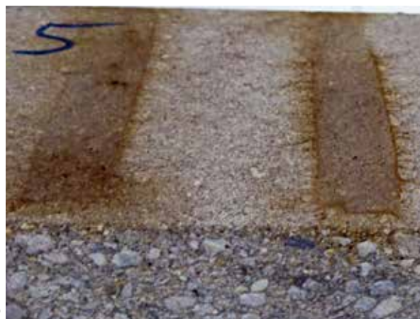
Figure: MPVA Neuwied