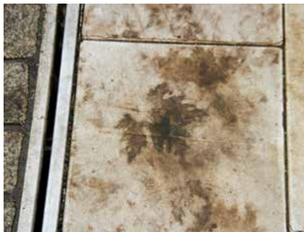
Figure: MPVA Neuwied