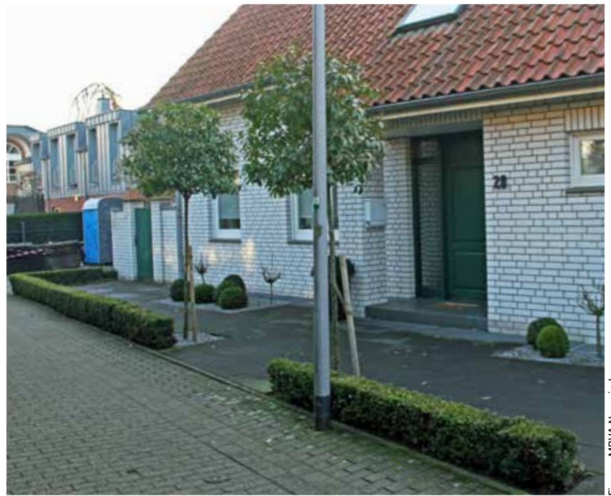
Figure: MPVA Neuwied

Figure 4 shows that in this area noticeable green deposits not only had formed on the concrete slabs but also on the masonry bricks of the wall. Regardless of the orientation of the pavement, clearly noticeable