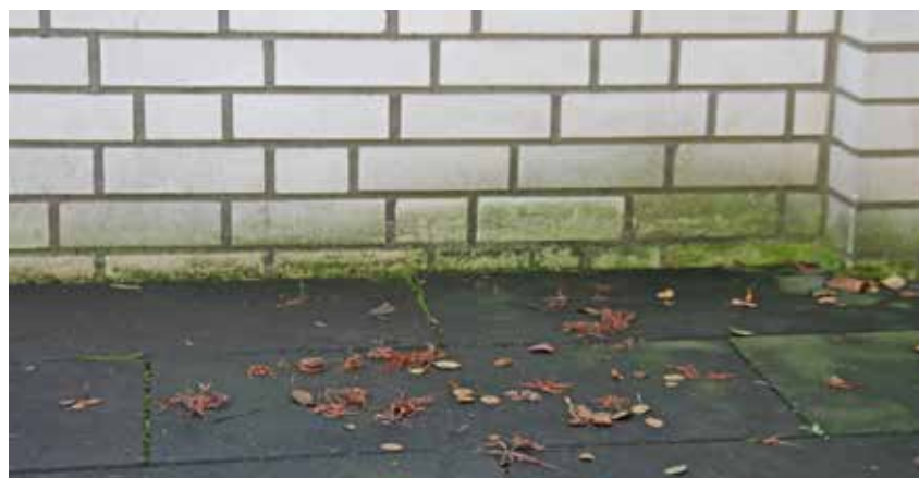
Figure: MPVA Neuwied

Im Rahmen des Rechtsstreits sollte sachverständig geklärt werden, ob die Betonplatten aufgrund des deutlichen Grünbefalls mangelhaft waren. Ein im Vorfeld eingeschalteter Sachverständiger hatte im Ergebnis festgestellt, dass einige Platten eine stärkere Grünbildung zeigten als