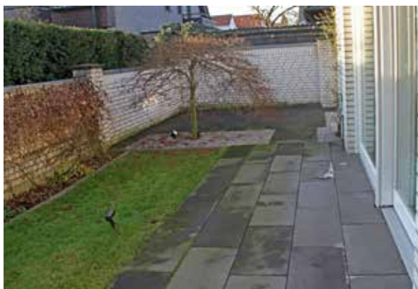
Figure: MPVA Neuwied