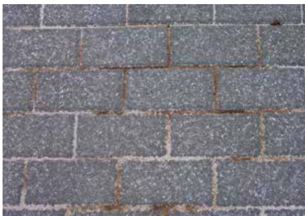
Figure: MPVA Neuwied