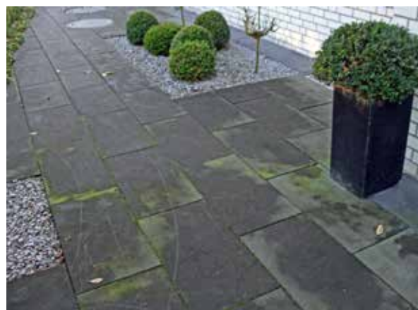
Figure: MPVA Neuwied