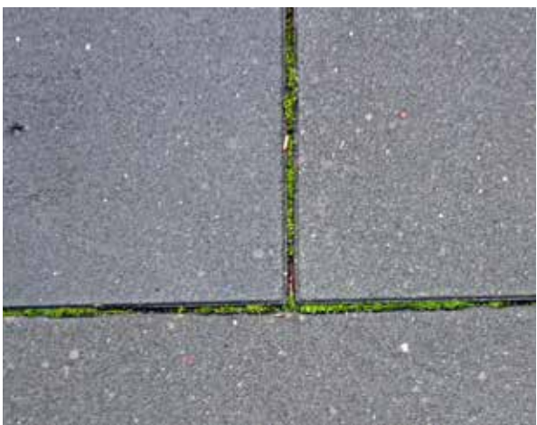
Figure: MPVA Neuwied

6 Green deposits in the joints of the concrete block pavement