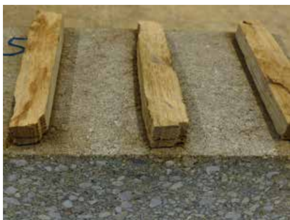
Figure: MPVA Neuwied