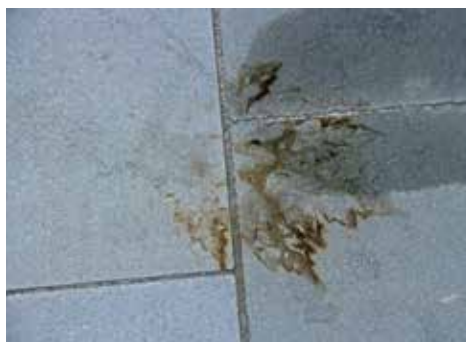
Figure: MPVA Neuwied