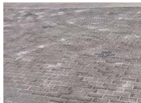
Figure: MPVA Neuwied

12 Discolorations from ... 12 Verfärbungen durch ... ... the effects of foliage