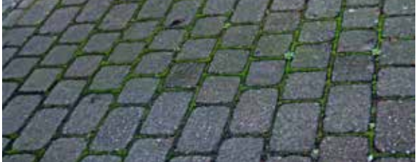
Figure: MPVA Neuwied

9 Green deposits on the concrete block pavement of the street (on the left of the picture)