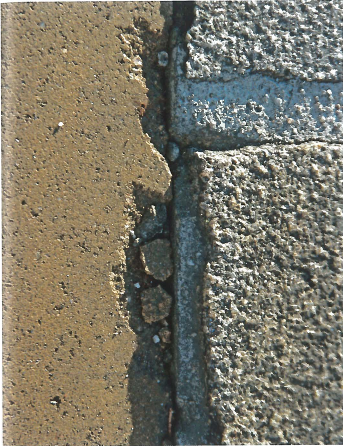
... parallel dazu führt die Verschiebung der gelockerten Pflastersteine auch zu Kantenschäden an den Betonplatten.

... in der Mörtelgruppe MG III: Vor dem Hintergrund der Anforderungen an die Eigenschaften der Bettungsmörtel und unter Berücksichtigung der Tatsache, dass die verwendeten Mörtel in gebundenen Pflasterdecken mindestens einer Frost- und ggf. sogar einer Frost-Tausalz- Beanspruchung ausgesetzt werden, ist festzustellen, dass „normale“ Mörtel der Mörtelgruppe MG III aus heutiger Sicht nicht geeignet zur Verwendung als Bettungs- oder Fugenmörtel in gebundenen Pflasterdecken sind. Die alten Regelwerke (Betonwerksteinkalender [L 2] oder DNV-Merkblatt [L 1]) sind daher als sehr kritisch zu betrachten. Planer ohne spezielle Erfahrungen mit der gebundenen Bauweise, die fälschlicherweise auf Basis dieser alten Merkblätter Mörtel der Mörtelgruppe MG III zur Herstellung von gebundenen Pflasterdecken ausschreiben, müssen nicht selten die Verantwortung für Schäden an gebundenen Pflasterdecken übernehmen.