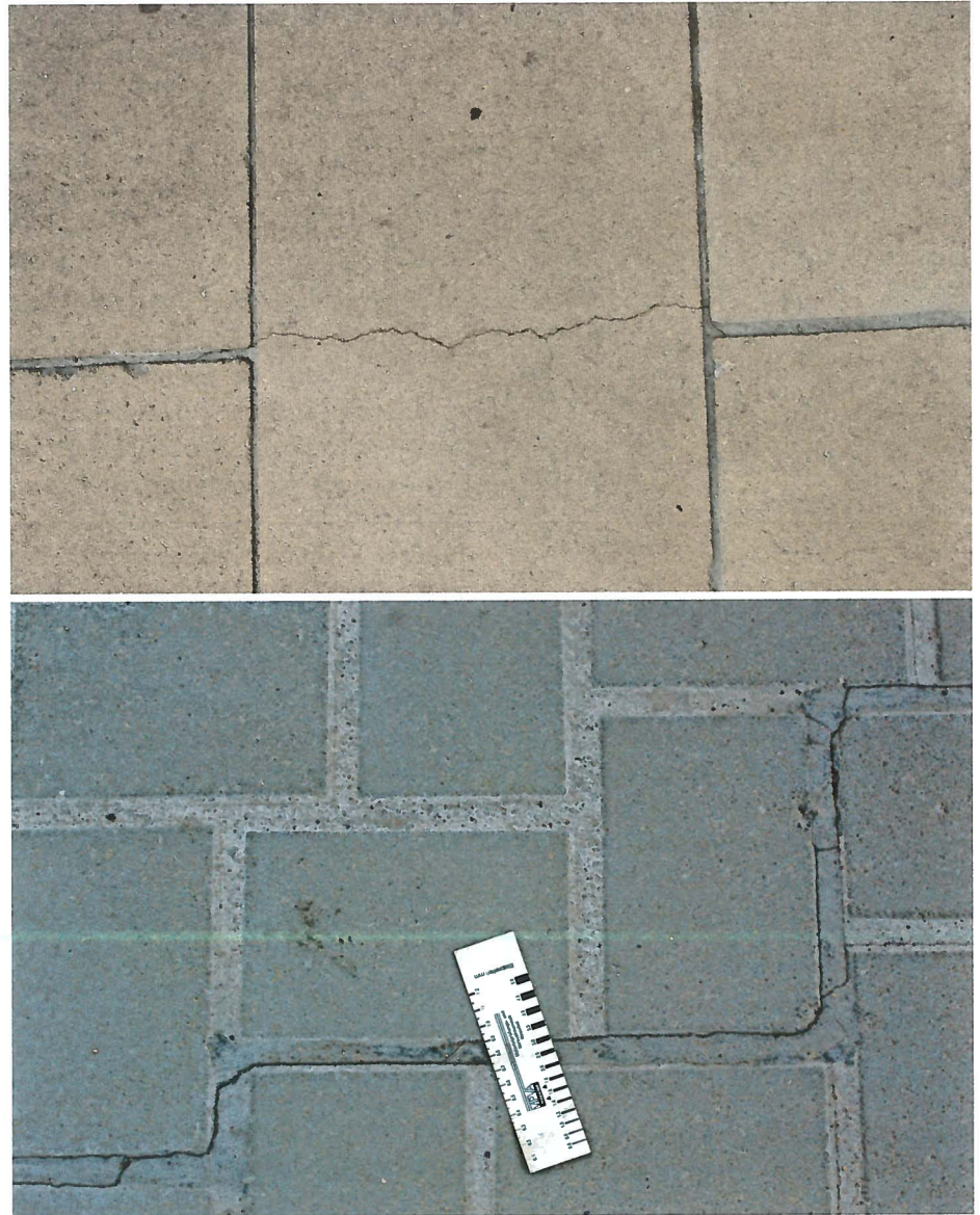
Risse entstehen häufig im Fugenmörtel und setzen sich dann über die Betonplatte fort. In der Regel verlaufen sie quer zur Fahrtrichtung.

Das Risiko zur Bildung von Rissen in gebundenen Konstruktionen steigt mit zunehmenden Abständen zwischen den Bewegungsfugen und mit abnehmender Verbundfestigkeit zwischen dem Bettungsmörtel und der Pflasterdecke. Erwärmt sich eine gebundene Pflasterdecke, so dehnt sie sich aus, wobei sie sich bei nicht ausreichender Verbundfestigkeit zwischen der Pflasterdecke und dem Bettungsmörtel aufwölbt und hohe Biegespannungen an der Oberseite der Pflasterdecke entstehen. Allein die thermischen Verformungen aufgrund der Erwärmung gebundener Pflasterdecken können ohne weiteres zu Längenänderungen von 0,5 mm/m bis 1,0 mm/m führen. Zur Reduzierung der Gefahr von Spannungsrisen sollen die Abstände zwischen den Bewegungsfugen in gebundenen Pflasterdecken je nach Regelwerk bei 4 bis 7 Metern liegen. Darüber hinaus sind Bewegungsfugen an aufgehenden Bauteilen auszuführen. Alternativ können gebundene Pflasterdecken